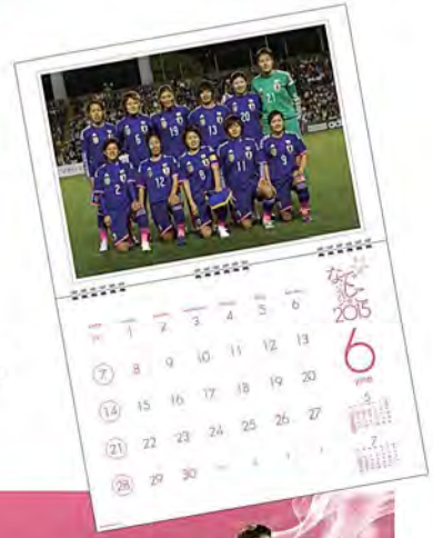
Japan Women's National Team Official Calendar 2015

③なでしこジャパン 壁掛けタイプカレンダー メーカー希望小売価格 ▶ 1,800円(税別) 1,944円(税込み) サイズ ▶ A3中折(420 mm ×297 mm ) ※展開時A2(420 mm ×594 mm ) 枚数 ▶ 13枚(表紙+中面12枚) ※掲載選手は2014年3月～5月迄の試合出場時間順上位25名となります